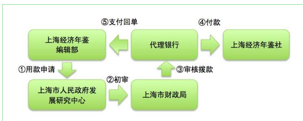
图 2 2016 年上海经济年鉴业务费资金拨付流程